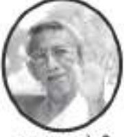
અદ્યાત્મ ચોગી આ.દે. ક્રીમદ્ વિજય કલાપૂર્ણાસૂરિશ્વરજી મ.સા.

॥ શ્રી પદ્મ-જીત-હિર-કનક-દેવેન્દ્ર-કંચન-કલાપૂર્ણા-કલાપ્રભ સૂરિભ્યો નમઃ ॥