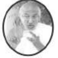
ગરબનાચક આ.ભ. ક્રીમદ્ વિજય રાધાભસૂરિ મ.સા.

॥ શ્રી પદ્મ-જીત-હિર-કનક-દેવેન્દ્ર-કંચન-કલાપૂર્ણા-કલાપ્રભ સૂરિભ્યો નમઃ ॥