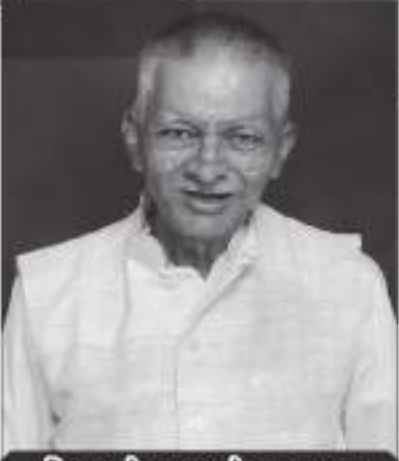
પિતાશ્રી ગુણશી દુદા સત્રા

સત્રા પરિવારની નિયાણી બહેનો પધારવા ભાવભર્યું આમંત્રણ